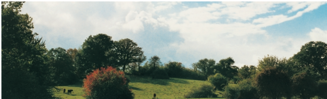
Græssende kvæg på Særløse Overdrev

Det skraverede område på kortet viser de områder, der i 1801 blev anvendt til græsning eller høslæt. I dag er det meste enten skov eller opdyrket jord, og kun en lille del anvendes fortsat til græsning