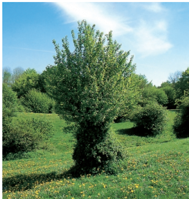
Skov-Abild (Vild æble) bidt af kvæg, Særløse Overdrev.

Planterne på overdrevet bar tydeligt præg af afbidningen. Tornede buske og træer som tjørn, slåen, hunderosen og skov-abild kunne modstå dyrenes bid. Beskyttet af dem voksede andre træer op, f.eks. bøg, eg, ask og hylde. Også urtefloraen havde tilpasset sig græsningen. Der kom tornede planter som lav tidsel, rosetplanter som høst-borst og giftige planter som engbrandbæger. Arter, som dyrene efterstræbte, klarede